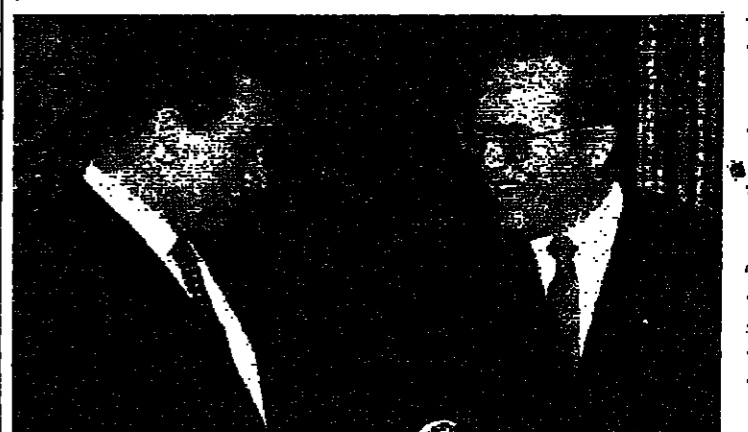
مارتنز خلال مقابلة مبارك

قال رئيس الوزراء الليجتي والفرنسي مارتنز للرئيس المصري حسني مبارك امس ان مساندة القاهرة لمسعى تقوم به المجموعة الأوروبية لاجل السلام في الشرق الاوسط ستشجعهم على الاستمرار والمثيرة في جهودها. وصرح السيد مارتنز بذلك اثناء حديثه في مأدبة عشاء، اقيمت تكريماً للرئيس مبارك، الذي وصل بروكسل امس، في مسهل جولة اوروبية، ستترقب تسعة ايام، يتوقع ان يحد خلالها الرئيس المصري أوروبا على لقب